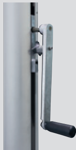
Kurbelhissvorrichtung alfa FlagLift ® , Handkurbel