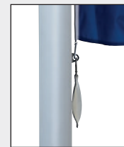
Untersten Karabiner – zusammen mit Fahnenstraffergewicht in Öse des untersten Fahnentuchhalters einhaken.