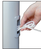
Nach dem Hissen Seil in Schlaufen legen und als Bund in das Bediengehäuse stecken.