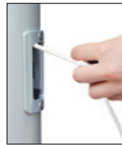
Hissen der Fahne durch horizontales Ziehen, Einholen durch Loslassen.

Die klassische Innenseilführung mit dem im Mastrohr laufenden PES-Hissseil. Die Handhabung des Hissseiles erfolgt über das Bediengehäuse mit (SchnellFixierSystem) alfa-SFS mit sperrbarem Türchen. Hissen und Abnehmen der Fahnen erfolgt durch Ziehen bzw. Nachlassen des Hissseiles. Bei Loslassen arretiert das Hissseil selbsttätig in der Spezial-Seilklemme im SFS-Gehäuse.