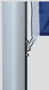
Zubehör: Fahnenstraffer, unverlierbar

5 Jahre Garantie auf Standicherheit der Mastrohre