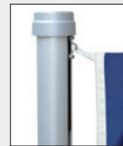
Obersten Fahnenkarabiner in Öse des Zugschlittens einhaken.

Es können alle gängigen, frei auswehenden Fahnen gehisst werden. Die maximal zulässigen Fahnenengrößen sind unter den technischen Daten aufgeführt. Abgespannte Bannerfahnen sind diese grundsätzlich ab 7 Beaufort (50 – 61 km/h) Wind abzunehmen.