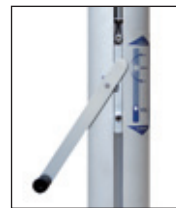
Kompaktantrieb, Handkurbel mit Entsperrstift