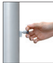
Entsperrstift ziehen, Riegel nach unten schieben: ENTSICHERN

Das patentierte Kurbel-Hissystem alfa FlagLift® besteht aus dem Kompaktantrieb mit VA-Antriebsrad, dem VA-Hissseil und dem Langschlitten mit Federvorspannung. Alle Bauteile befinden sich in der Mastnut. Die Seilarretierung wird durch eine Federbremse bewirkt, die durch einfaches Anheben des Sicherungsriegels das Antriebsrad blockiert und den Steckerzug für die Handkurbel verschließt. Die Entriegelung erfolgt mittels eines Spezial-Entsperrstiftes in einem Handgriff.